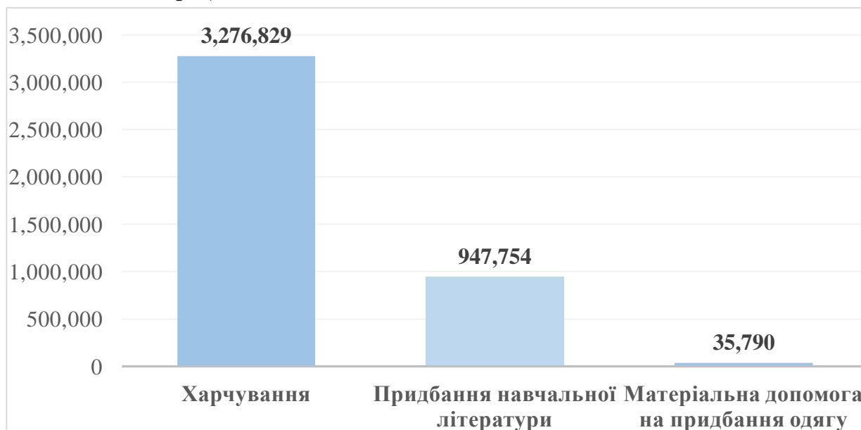
Рисунок 2.2.3. Виплати студентам/кам сиротам, грн.

У Шосткинському інституті витрати на студентів-сиріт склали – 519 362 грн (2023- 614 993,00 грн.)