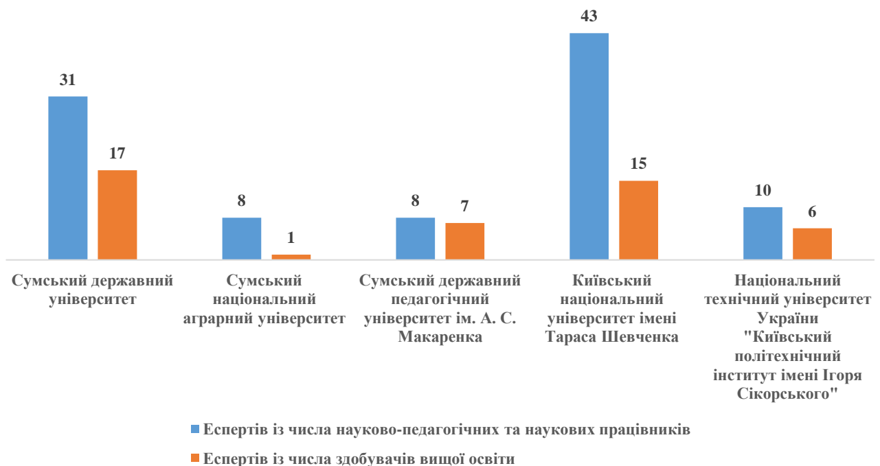
Рисунок 3.1 – Дані про експертів, які залучені до проведення акредитацій освітніх програм Національного агентства із забезпечення якості вищої освіти з галузей знань, за якими здійснюється підготовка фахівців в СумДУ (станом на 15 грудня 2020 р. згідно з опублікованими реєстрами НАЗЯВО)

Аналіз реєстру експертів Національного агентства із забезпечення якості вищої освіти з числа науково-педагогічних, наукових працівників та здобувачів вищої освіти свідчить про те, що СумДУ має найбільше представників серед регіональних ЗВО (рис. 3.1). Порівнюючи СумДУ з університетами «ТОП-200 Україна» 2020 року за чисельністю експертів Національного агентства в розрізі галузей знань, за якими здійснюється підготовка фахівців в університеті, слід зазначити, що Київський національний університет ім. Тараса Шевченка випереджає СумДУ за кількістю експертів із числа науково-педагогічних та наукових працівників.