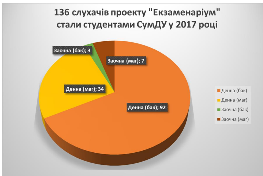
Рисунок 3 – Кількість слухачів «Екзаменаріуму», зарахованих до СумДУ

Ефективність проекту «Екзаменаріум» ілюструє рисунок 3.