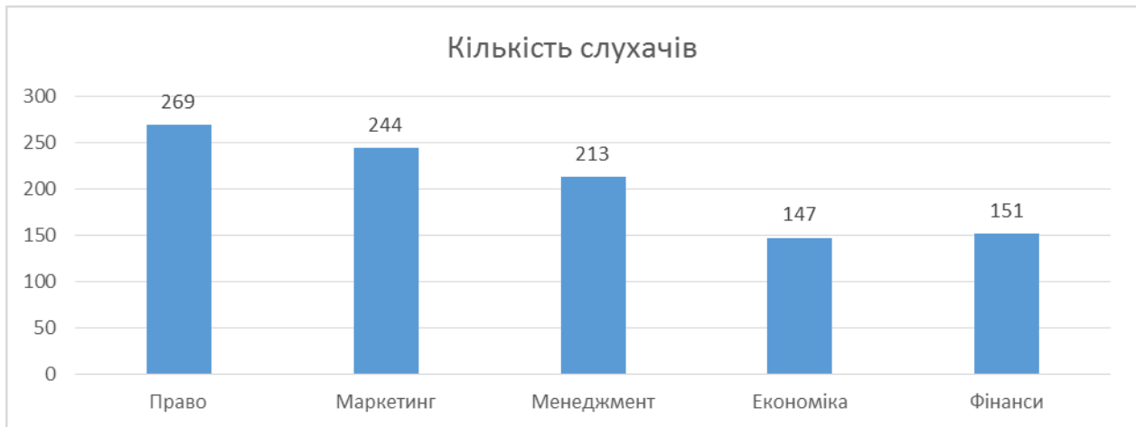
Рисунок 2 – Розподіл слухачів за напрямами підготовки.

За підсумками проведеного конкурсу з розроблення електронного контенту МВОК у 2017 році з 21 конкурсної заявки 4 нові онлайн-курси успішно пройшли повний цикл розробки та комплексну перевірку. Розроблені курси орієнтовані передусім на широкий контингент слухачів та потенційних абітурієнтів: