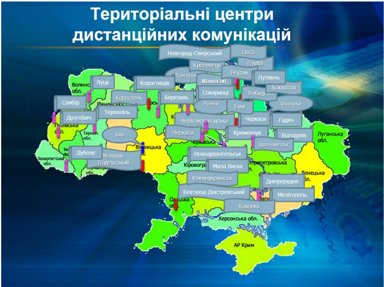
Рисунок 1.1 – Територіальні центри дистанційних комунікацій

У 2015 р. відбувся значний перерозподіл ліцензованих обсягів за заочною формою навчання. За освітнім рівнем «Бакалавр» відбувається підготовка фахівців за 18-ма напрямками підготовки (без змін у порівнянні з минулим роком), за ОКР «спеціаліст» відбулося зменшення на 9 спеціальностей і за освітнім рівнем «магістр» на 6 збільшено кількість спеціальностей, а саме: «Журналістика», «Правознавство», «Інформаційно-телекомунікаційні технології», «Інформаційні технології проектування», «Комп'ютеризовані системи управління та автоматика», «Енергетичний менеджмент», «Електротехнічні системи електроспоживання» та «Управління фінансово-економічною безпекою». Загалом за заочною формою навчання відбувається підготовка за 18-ма напрямками освітнього рівня «бакалавр», за 12-ма спеціальностями ОКР «спеціаліст» та 31-ю спеціальністю освітнього рівня «магістр».